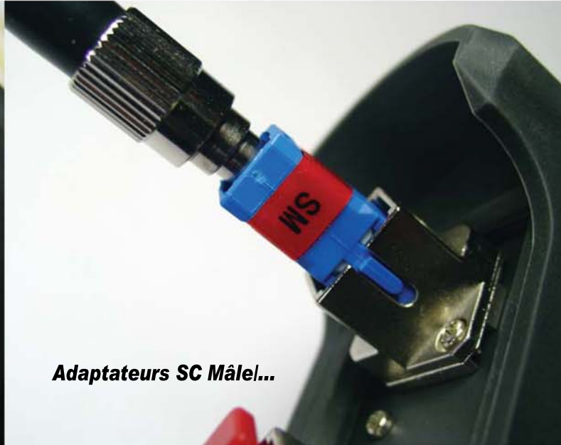
Adaptateurs SC Mâle...